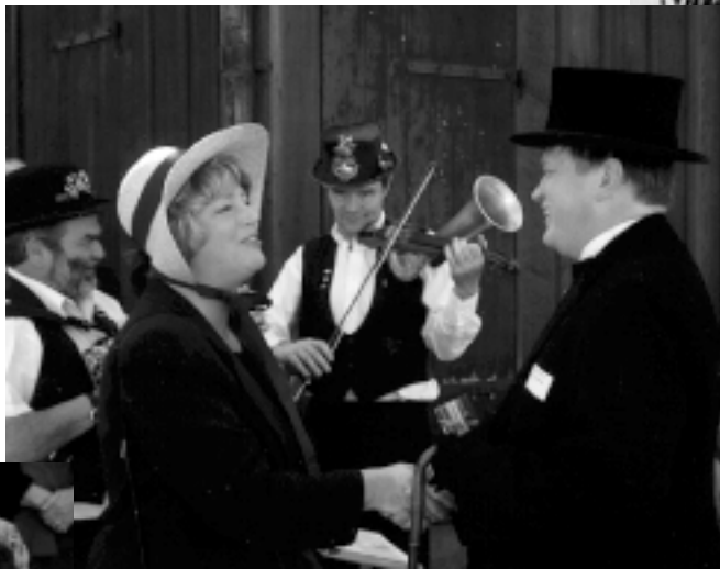
Borgmästare och intendent (ovan) i högljutt samspråk för att överrösta gårdsmusikanterna!