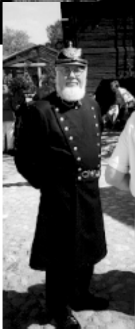
Kvartersspolisen "håller ett öga" på arrangemanget.