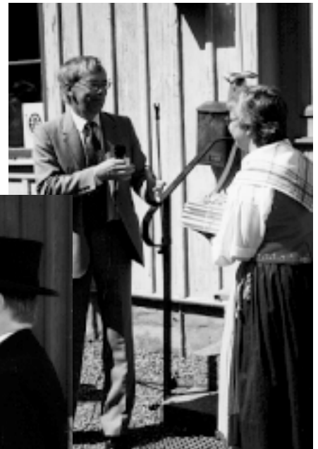
DIS och ÖGF uppvaktas av Landsarkivet i Vadstena