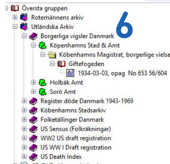
Bild 6. Mitt källträd med utländska arkiv. Se hur en borgerlig vigsel i Köpenhamn är registrerad.

Då jag själv jobbade några månader på ett kyrkokontor i Danmark som kordegn, vet jag ju hur kyrkböckerna förs rent praktiskt, eller fördes ska jag kanske säga då det är 40 år sedan. Jag vet även hur det civila samhället med befolkningsregister fungerade då det var en kommunal angelägenhet, inte en kyrklig som här i Sverige. □