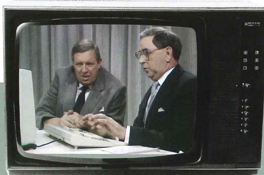
Disgen presenteras i SVT:s Tekniskt Magasin 1978.